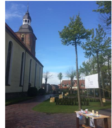
Tag der offenen Tür im Messdienerhaus 2017

Auf Wunsch können Sie eine Spendenquittung erhalten. Sprechen Sie uns gerne darauf an.