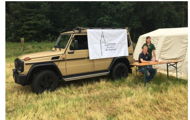
Elternsonntag im Zeltlager 2017